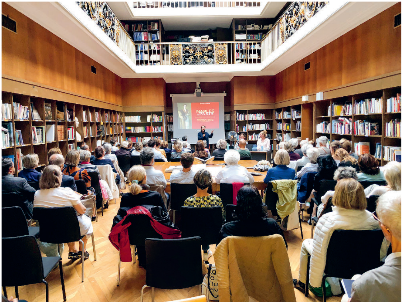
Centre Dominique-Vivant Denon

Journée du 11 décembre ouverte au public, Centre Dominique-Vivant Denon. Inscription obligatoire à centre-vivant-denon@louvre.fr . Les inscrits sont priés de se présenter munis de leur carte d'identité. Centre Dominique-Vivant Denon, musée du Louvre, Porte des Arts :